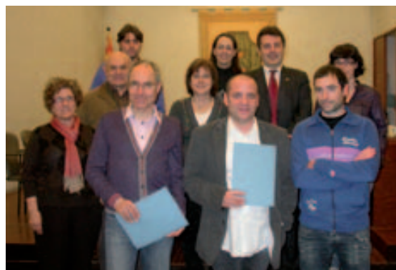
Signatura dels convenis amb entitats d'educació, acció social i joventut

social, de promoció econòmica, de festes i esportives. En total s'han signat 46 convenis amb entitats que sumen uns 400.000 euros, malgrat la disminució d'un 10% arran dels reajustos econòmics.