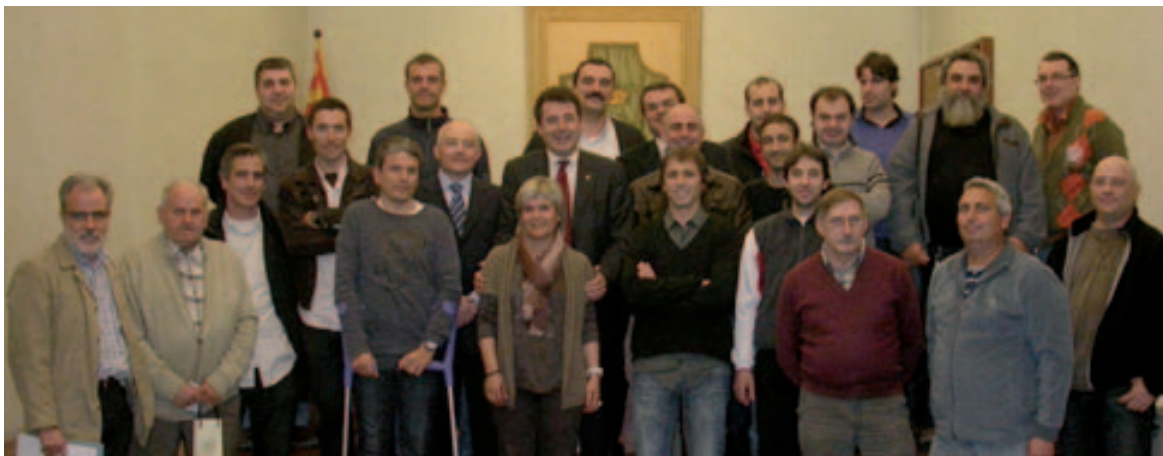
Signatura dels convenis amb entitats esportives