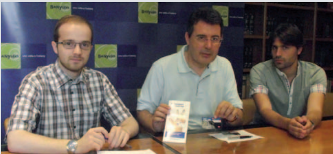
Noves beques de transport pels estudiants de Banyoles que estudien fora de la ciutat

La programació estable de joventut, el Pla B, va incloure 11 propostes com ara el taller de riure, una introducció al rol de taula, un tast de cerveses, entre d'altres. La programació bimensual es difon a través del tríptic que s'edita des de l'Ajuntament o pel Facebook. Amb el nou Espai Jove Cal Drac, unes instal·lacions definitives, es poden programar més activitats i fer noves propostes com ara el tennis taula.