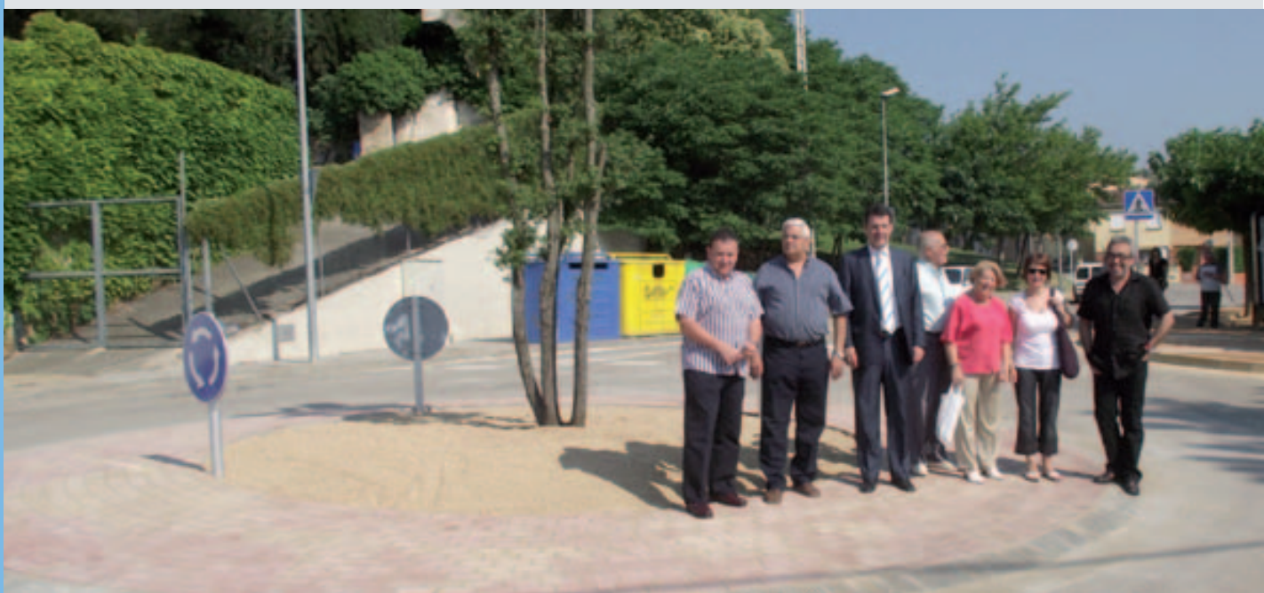
La reivindicada rotonda de Mas Palau

L'Ajuntament de Banyoles ha aprovat la reordenació urbanística de la plaça de les Monges per traslladar-hi