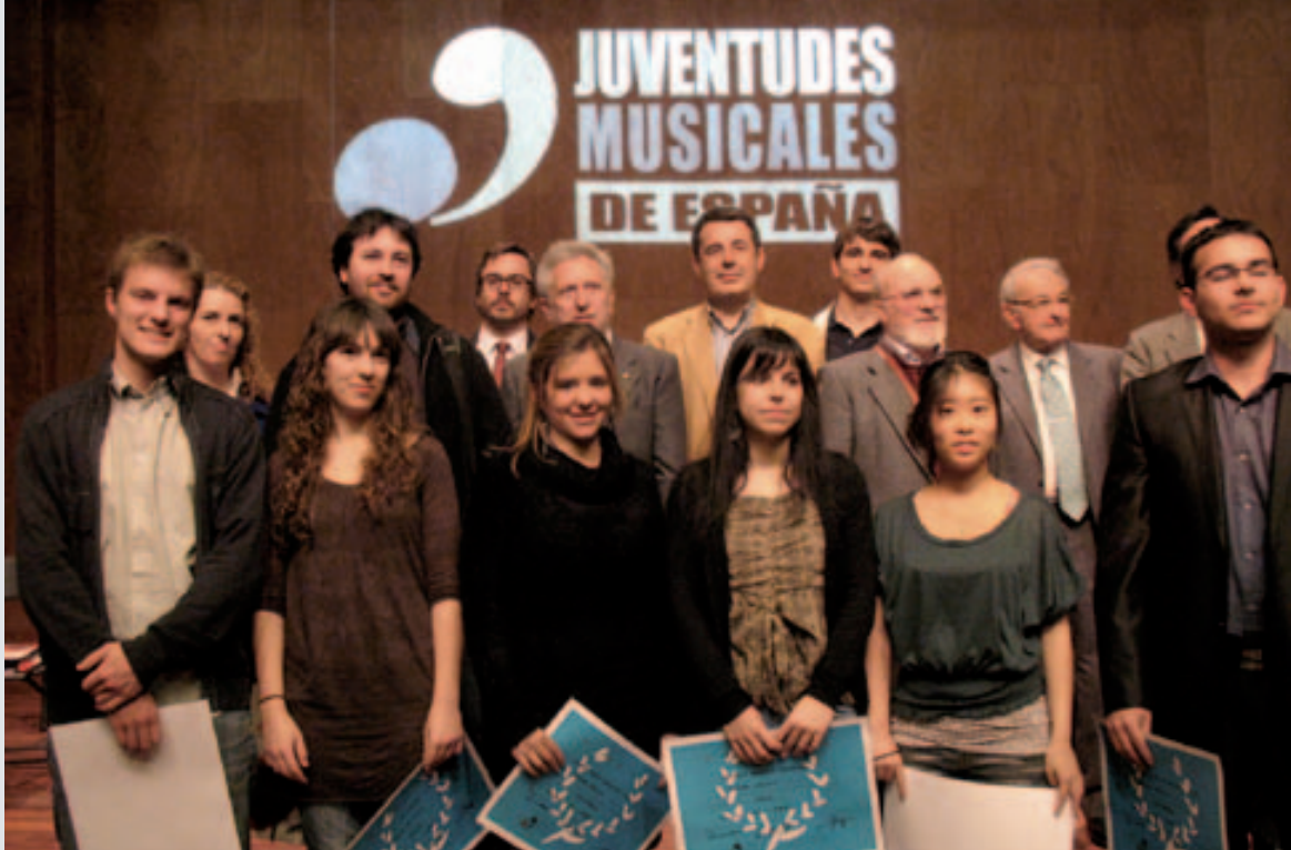
Els guanyadors del 73è Concurs Permanent de Joves Intèrprets acompanyats de l'alcalde i personalitats