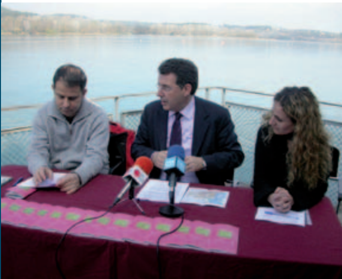
Nou itinerari llegendari de Banyoles

Les setze llegendes són en Morgat, el Castell Enfonçat, la mitja taronja, els miracles de Sant Mer, el Drac de Banyoles, voguen les campanes, la gran sequera, la font de les Ànimes, la ceguera de l'abat, en pagès de