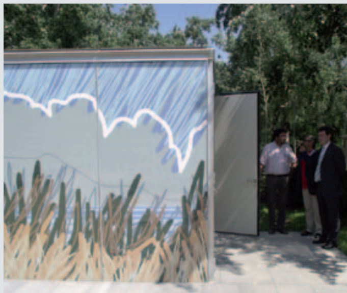
Un dels dos lavabos de l'Estany

El Consorci de l'Estany, amb la col·laboració de l'Ajuntament de Banyoles, ha instal·lat dos mòduls de lavabos públics integrats a l'entorn de l'Estany gràcies al seu disseny. Un està situat a la zona de pícnic del parc de la Draga i l'altre al costat de la Caseta de Fusta, dos punts de l'entorn natural de l'Estany altament freqüentats per turistes i per banyolins i banyolines.