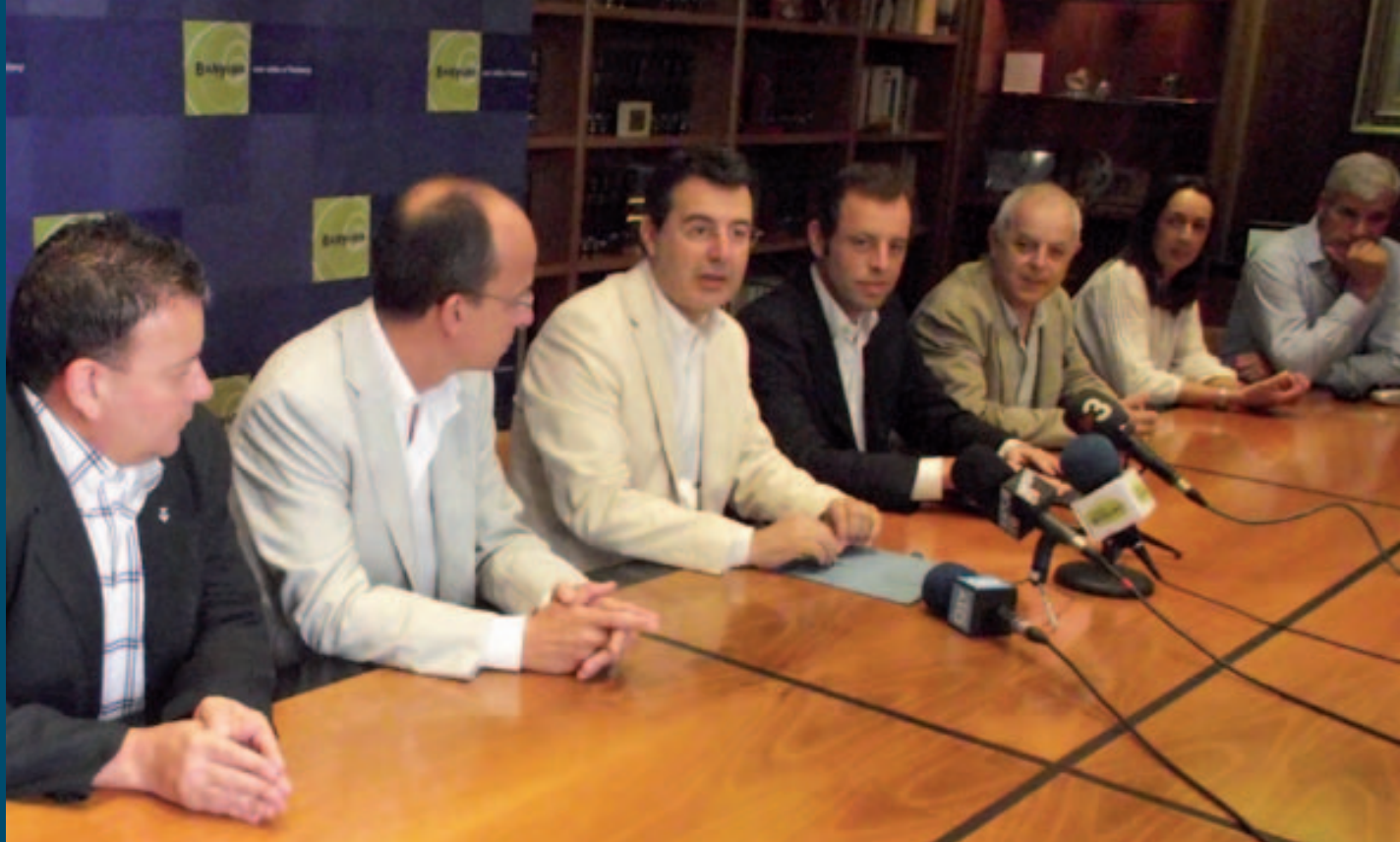
El nou president del FC Barcelona, Sandro Rossell, a l'Ajuntament de Banyoles