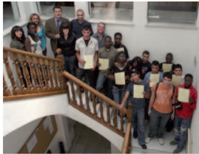
Els alumnes de l'Escola Taller van rebre els diplomes

Una vintena d'empresaris familiars del Pla de l'Estanty van participar, a la sala d'actes de l'Ajuntament de Banyoles, a la jornada de presentació de la Càtedra i el Baròmetre de l'Empresa Familiar. És una de les