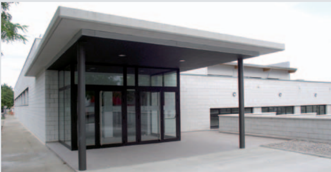
Banyoles estrena el nou centre de tecnificació i formació esportiva de la Farga