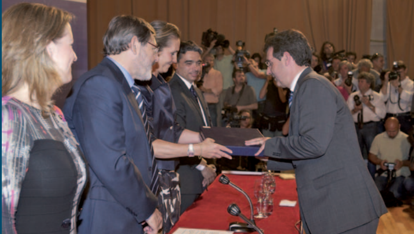
L'alcalde recollint la Placa de Bronze del Reial Ordre del Mèrit Esportiu.