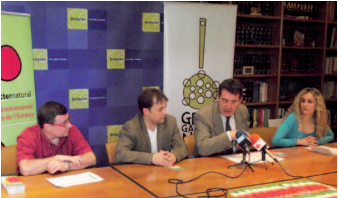
Presentació del VI Juny Gastronòmic del Pla de l'Estany