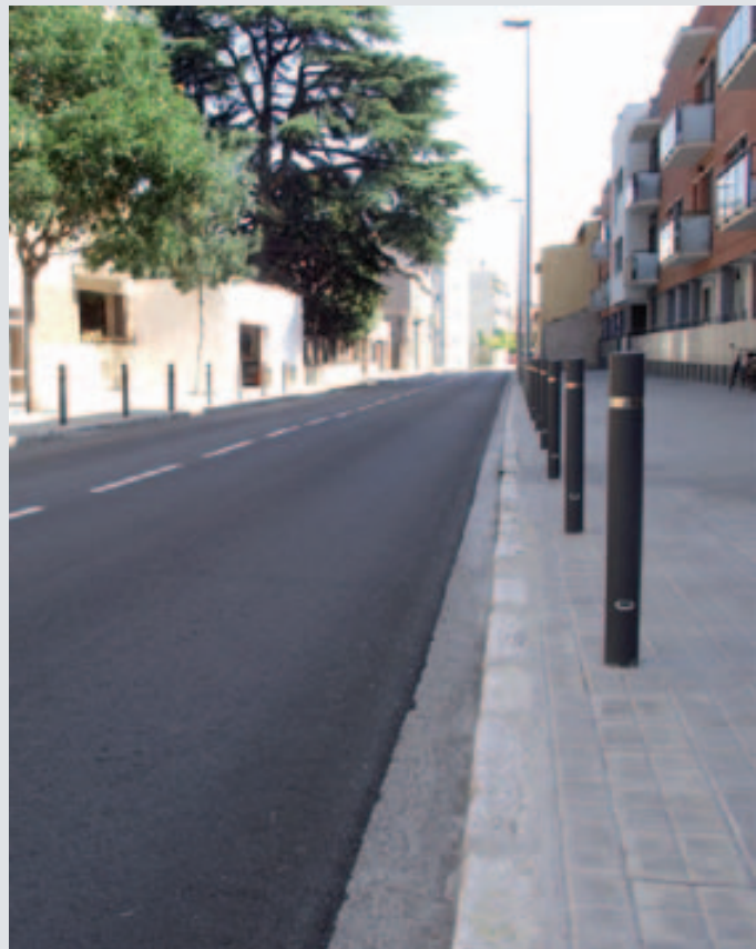
El carrer Abat Bonitus és un dels carrers reasfaltats

L'Ajuntament ha començat un nou pla de reasfaltatge de diferents carrers de la ciutat. Aquesta fase inclou l'asfaltatge del carrer Abat Bonitus, la cruïlla d'accés al veïnat de Lió i un tram del carrer de la Formiga, des de la plaça Països Catalans fins al carrer Pere Alsius. Tanmateix, l'actuació més important es va aplicar a l'avinguda de la Farga, on es van repassar i millorar totes les zones on l'asfaltatge estava malmès. El cost d'aquestes actuacions va ser d'uns 70.000 euros.