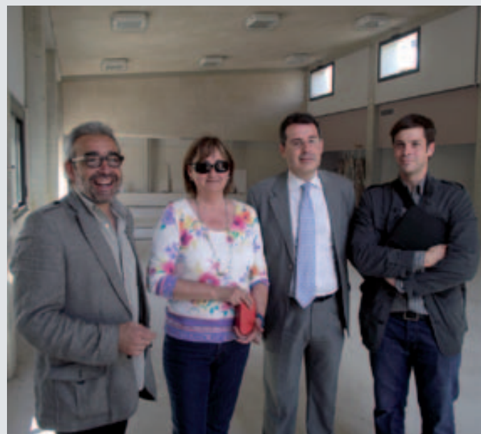
El CEIP Baldiri Reixach, la Vila, estrena l'històricament reivindicat gimnàs

L'obra dissenyada per l'arquitecte banyolí Xavier Cornejo ha costat 325.000 euros, dels quals la Generalitat n'ha pagat 300.000 i l'Ajuntament la resta.