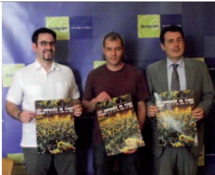
Presentació de la 33a Exposició de Flors

Enguany la diada de Sant Jordi va està marcada per la pluja, que va deslluir el seu caràcter festiu. Malgrat tot els banyolins i banyolines es van acostar fins a la plaça Major per comprar la rosa i el llibre.