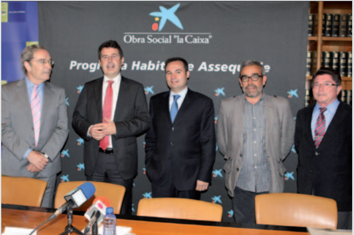
L'Obra Social de "la Caixa" promou 64 habitatges de lloguer assequible.