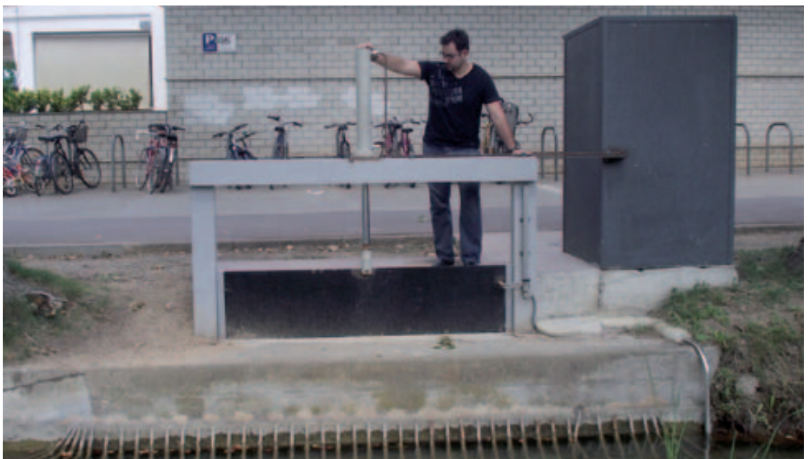
S'ha automatitzat la comporta del col·lector situada a l'inici del rec de ca n'Hort

El primer èxit del projecte es va aconseguir la primavera passada quan es va establir la primera parella nidificant a la zona i va néixer el primer pollet al Pla de l'Estany. La parella està formada per un mascle alliberat a Banyoles la primavera de 2008 i una femella alliberada a Santpedor la primavera de 2007.