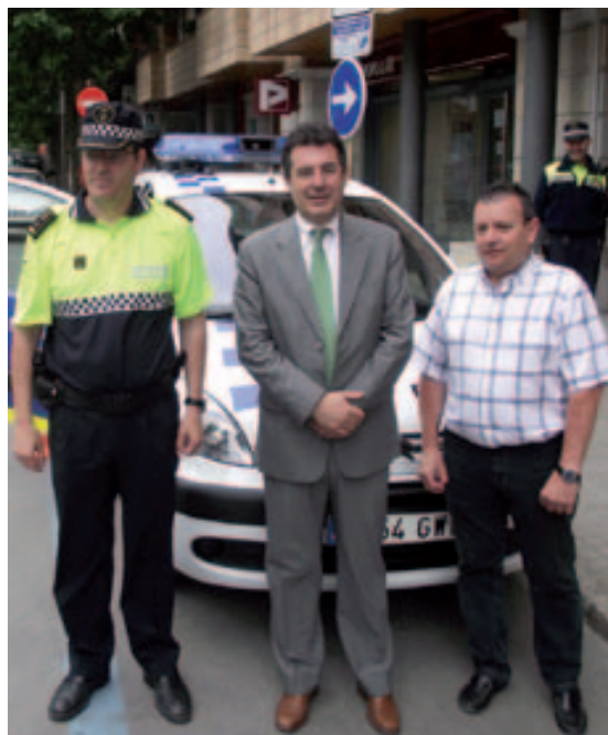
El nou cotxe per patrullar per Banyoles

Properament es convocaran dues places de Policia Local que estan vacants. Malgrat l'afectació del Pla de sanejament de l'Ajuntament de Banyoles la seguretat