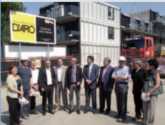
Visita als pisos amb protecció oficial per a joves del carrer Orfes

La Fundació Bisbe Tomas de Lorenzana prepara l'edificació de 72 habitatges socials a Banyoles en el solar de l'antiga casa de l'Espiritualitat, al costat del Monestir. La Fundació treballa amb l'objectiu que el cost del lloguer més el dels serveis no sumi més de 300 euros.