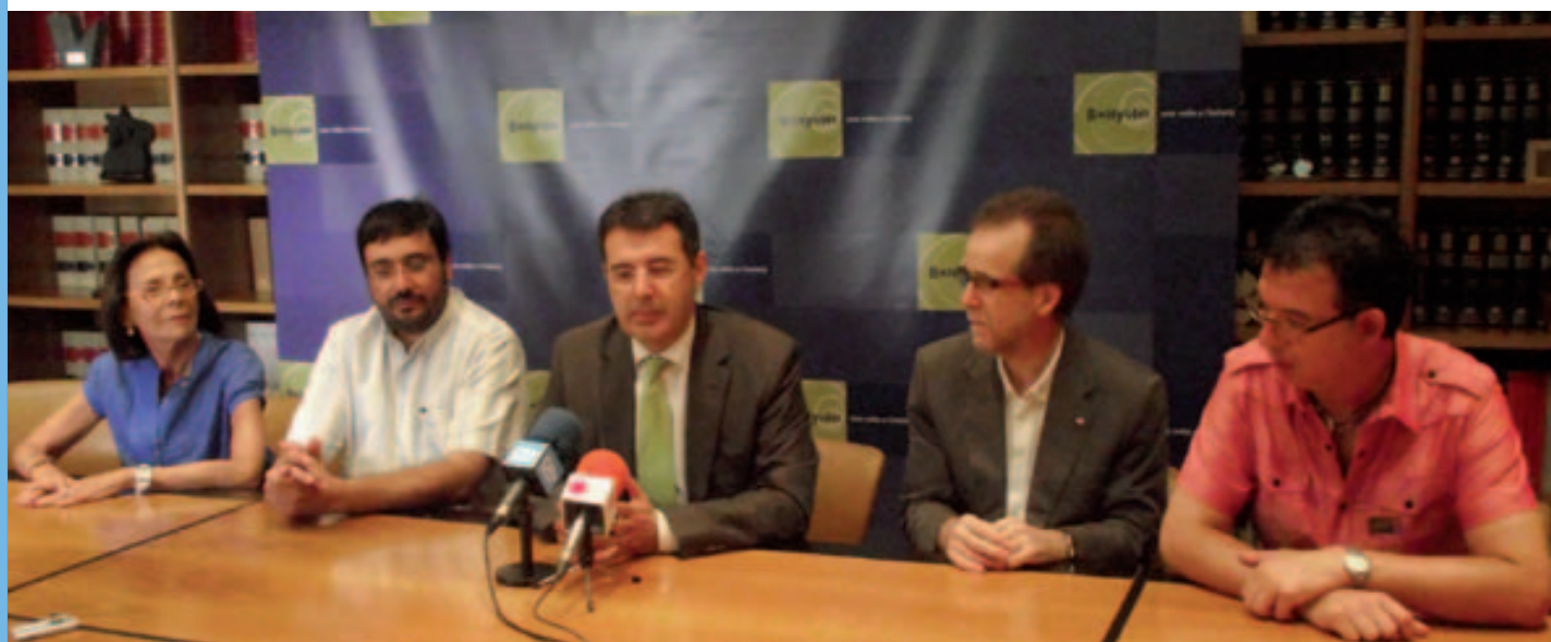
Roda de premsa de l'anunci de la Creu Roja del Pla de l'Estany de la compra d'un local al centre de Banyoles

Abans de la crisi econòmica el Consorci de Benestar Social del Pla de l'Estany - Banyoles distribuïa a famílies necessitades uns 3.000 euros en aliments a l'any de mitjana. Tanmateix, durant els últims anys la partida del Consorci destinada a ajudes directes en aliments ha augmentat considerablement. El 2007 l'Ajuntament