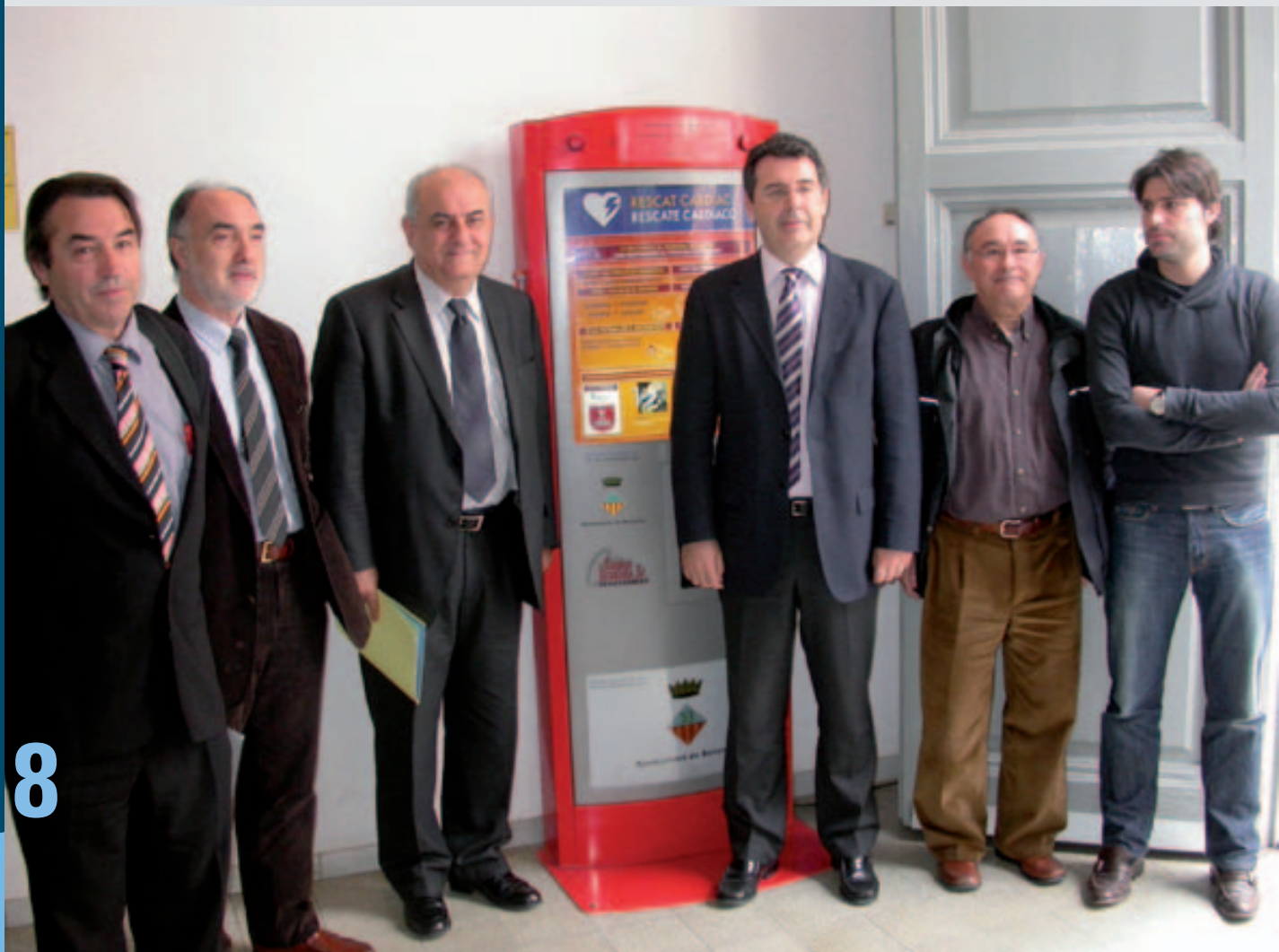
Banyoles pionera a Catalunya i l'Estat espanyol pels electrocardiogrames als alumnes de segon d'ESO